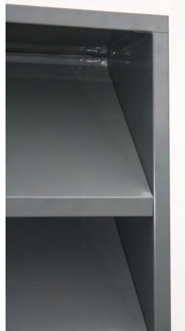
Lydreduserende Ventilasjonsrist sett fra baksiden.